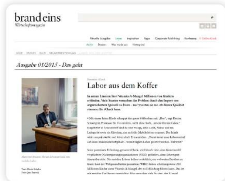
Die Webseite erreicht monatlich rund 700.000 Ad Impressions.*

Die Preise sind Tausender-Kontakt-Preise (TKP) und verstehen sich zzgl. der gesetzlichen Mehrwertsteuer. Die Preise sind AE-fähig, aber von Rabatten ausgenommen.