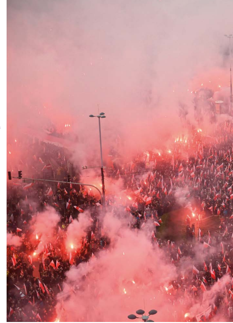
Wer 1933 in Berlin nicht dabei war, kann jetzt in Polen erleben, wie das damals wohl aussah: Aufmarsch von polnischen Rechtsextremen.

Bei Linklaters gilt noch die britische Tradition: Die Kanzlei zählt mehr als der Einzelne. Dem Erfolg schadet das nicht.